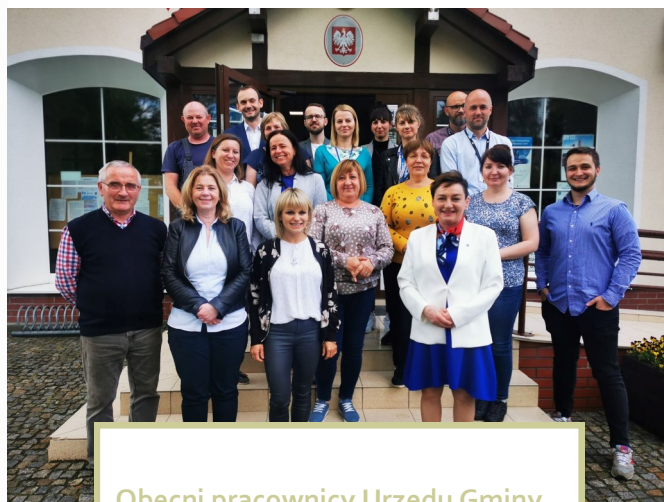
Obecni pracownicy Urzędu Gminy

„dziurę” w rozwoju, przede wszystkim infrastruktury, przez prawie 20 lat niebytu na mapie administracyjnej w porównaniu do