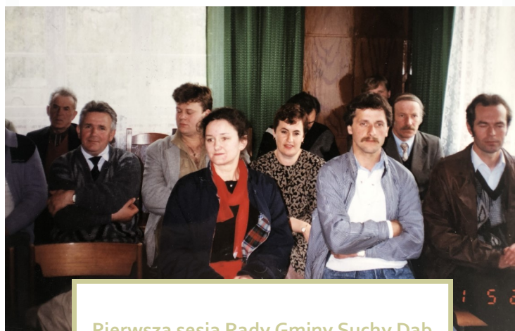
Pierwsza sesja Rady Gminy Suchy Dąb

„W ówczesnym czasie nikt nie miał za bardzo pojęcia jak tworzyć gminę praktycznie od początku, mimo, że w naszym przypadku była to reaktywacja, jednak proceduralnie wygląda to tak samo. Staraliśmy się wymieniać doświadczeniami z tworzącymi się w tym samym czasie Gminą Krynica Morska czy Bobowo, bo napotykaliliśmy sporo problemów, żeby zorganizować w Suchym Dębnie wszystko od nowa. Jako sekretarz Gminy Pszczółki zostałem zobowiązany przez Komitet do działania organizacyjnego polegającego na utworzeniu miejsc do pracy dla przyszłych urzędników.