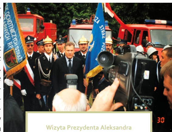
Wizyta Prezydenta Aleksandra Kwaśniewskiego u druchów z OSP