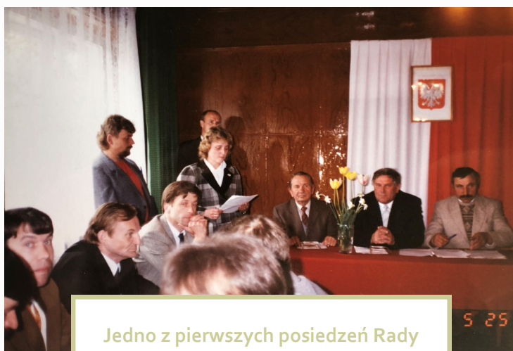
Jedno z pierwszych posiedzeń Rady Gminy Suchy Dąb