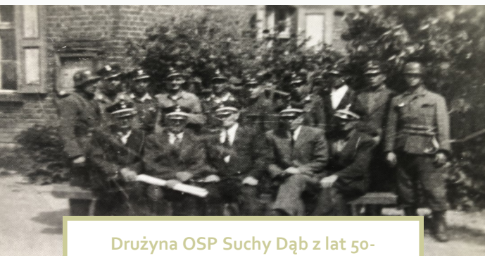
Drużyna OSP Suchy Dąb z lat 50-tychtych