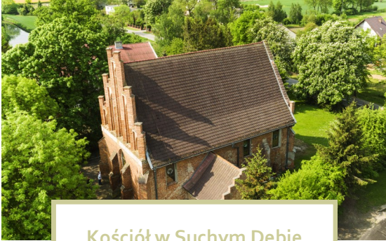
Kościół w Suchym Dębnie