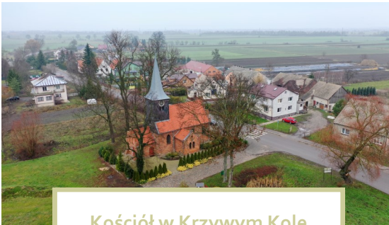
Kościół w Krzywym Kole