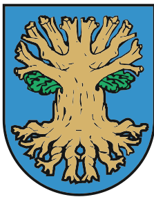
4175 mieszkańców w Gminie Suchy Dąb na dzień 31-12-2023

5 par z naszej gminy obchodziło jubileusz 50-lecia pożycia małżeńskiego „Złote Gody” oraz 1 para jubileusz 60-lecia pożycia małżeńskiego, rocznicę „Diamentową”.