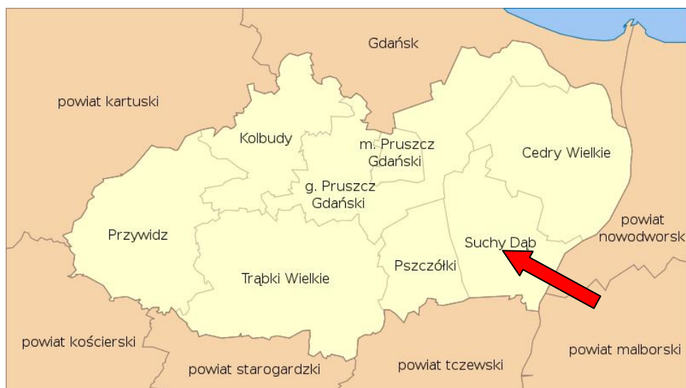
Rycina 1: Położenie gminy Suchy Dąb w powiecie gdańskim

Źródło: http://pl.wikipedia.org/wiki/Plik:POL_powiat_gda%C5%84ski_locator_map_(label-pl).svg#filelinks , w dniu 23.10.2013 r.